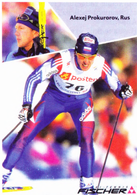
1997 г. Гонка на 30 км в Тронхейме.

Первый лыжный переход олимпийских чемпионов Алексея Прокуророва и норвежца Вегарда Ульванга по Чукотке.