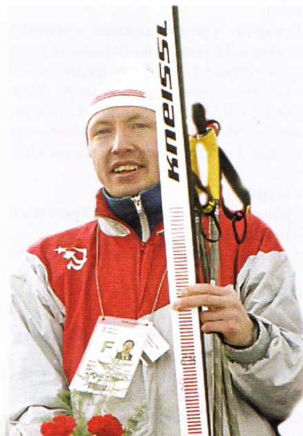
1988 г. Калгари (Канада). «Золото» Олимпийского чемпиона.

15.02.1988. Кэнмор (Канада) – 30 км кл.с – 1 место.