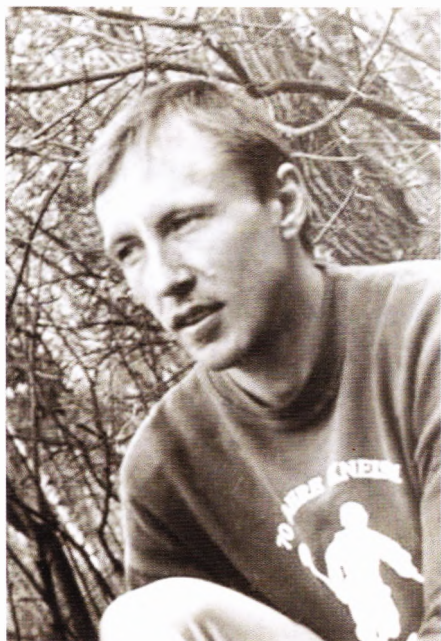
1993 г. Муром. Ни дня без тренировки.