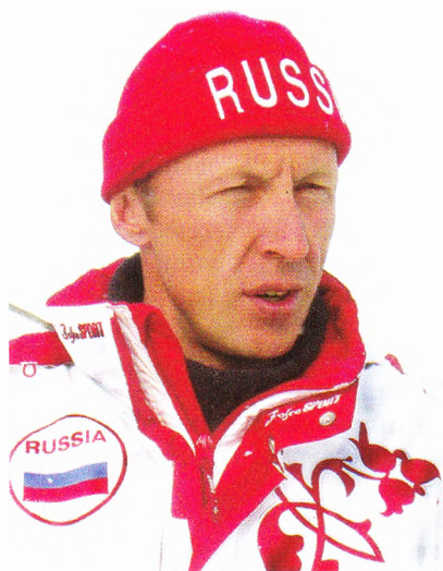
1996 г. Дома после Нагано.