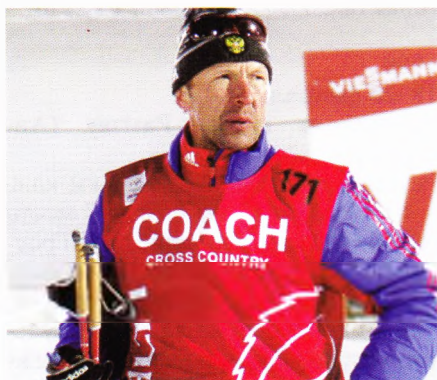
2007 г. В Саппоро на чемпионате мира в Японии.

Участие в традиционных соревнованиях по лыжным гонкам на снегу в подмосковной Сходне. В гонке легендарных чемпионов соревнуются чемпионы Олимпийских игр Михаил Девятьяров, Ольга Данилова, Светлана Нагейкина, Вячеслав Веденин и многие другие.