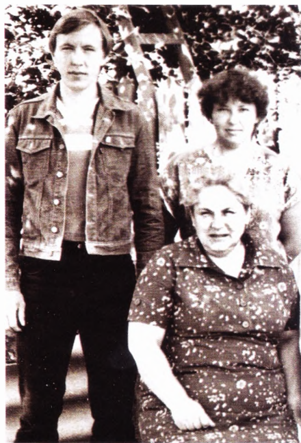
15 мая 1981 г. С матерью и сестрой.

Он ушел из жизни в марте 1985 года, не дожив нескольких дней до своего пятидесятилетия. Сказалось