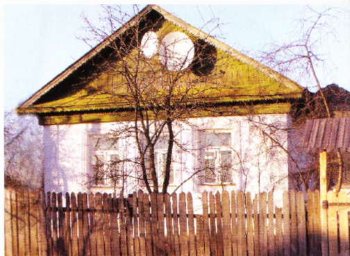
Деревня Мишино. Родительский дом.

Самым первым выпускником этой школы гордится всё Мишино. Выходец из крепкой, по нынешним временам считавшейся бы многодетной, крестьянской семьи Григо-