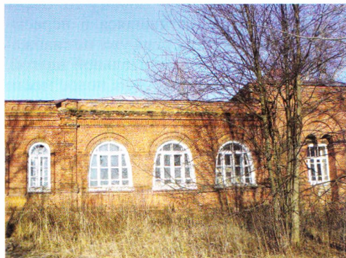
Мишино. Сельская школа.