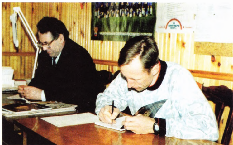
1998 год. После встречи в редакции Алексей Прокуроров написал пожелания читателям Владимирской спортивной газеты.