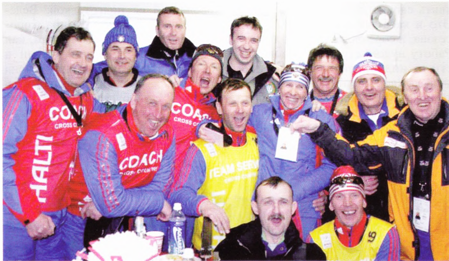
«Эта радость на всех одна...».