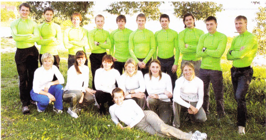
2008 год. Основной состав сборной России.