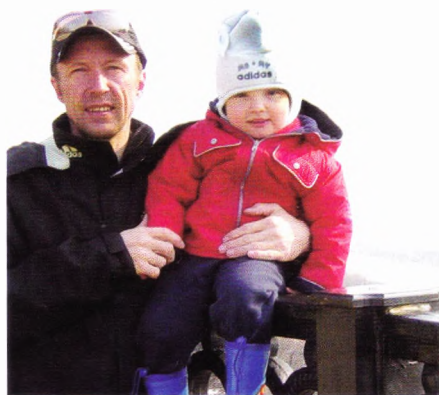
...апрель во Владимире...