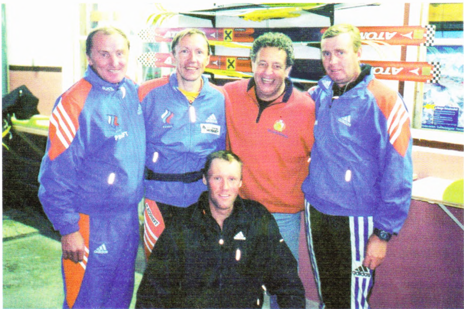
Свой среди своих.