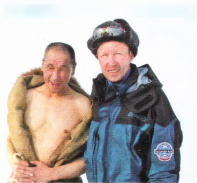
Этот целиковый костюм из шкур надевается на голое тело.

ревнями, а так старались ночевать в поселках.