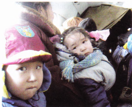
Из Бухты Провидения летели на вертолёт местной линии.

Первый переход был у нас довольно длинный – 55 километров. Первый привал на маршруте мы сделали в заброшенном домике на берегу океана. Он специально предусмотрен для вынужденной ночёвки путников. Припай был еще у берега, поэтому торосы были видны лишь вдаль. Ещё по дороге мы встретили чукчу, едущего нам навстречу из Нурмена в Нешкан. Он вёз своей сестре нерпу в подмогу, для хозяйственных целей. Охота на нерпу уже началась, появились первые полыньи, и местные уже начали её стрелять. Мы немного поговорили с ним и отправились дальше. Основным отличием от первого похода было то, что тогда мы все свои вещи тащили на себе, на санях или в рюкзаках за плечами, а сейчас у нас была собачья упряжка. В палатках мы ночевали только три ночи, на длинных перегонах между де-