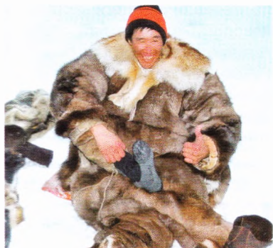
Наш проводник примерил фирменные носки Вегарда.