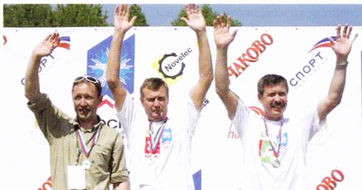
Репортаж «Майская лыжня-2007» в подмосковной Сходне – на следующей странице.