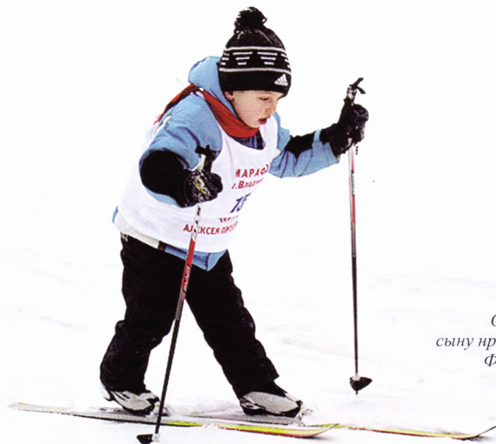
Отец был прав: сыну нравится целина. Фото 2009 года.