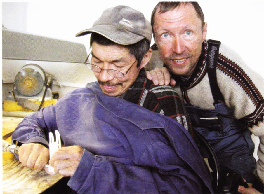
Резьба по кости – национальный чукотский промысел. В посёлке Уэлен есть косторезная мастерская.

Эту ночь мы тоже провели в палатке. Проснувшись с утра, мы увидели картину: наши сопровождающие спят на нартах немного занесённые снегом, рядом в сугробах свернулись собаки. То есть они – настоящие привыкшие охотники, для которых ничего страшного – провести ночь под звёздами. Это утро также запомнилось тем, что мы развели костер. Обычно-то мы готовили завтрак на примусах, но в этом месте Анатолий, работавший раньше оленеводом, нашел запас дров.