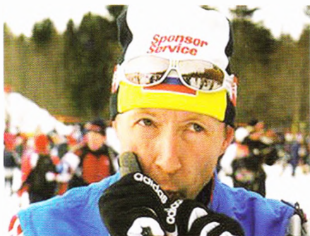
2005-й: февраль в Оберstdорфе...