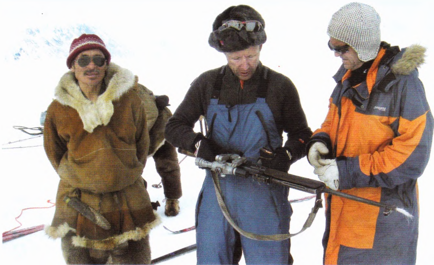
Охотничье ружье необходимо на случай, если встретится медведь.

Сначала, когда мы шли, ещё не было полыней. Но во время урагана ветер дул в сторону моря, поэтому появилась открытая вода – стало возможно ловить рыбу, охотить-