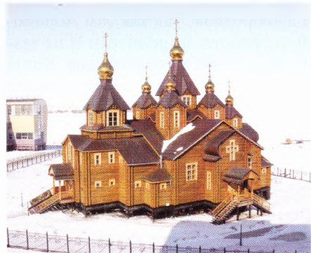
Анадырь живёт современной жизнью. Дома красивые, дороги идеальные, в магазинах изобилие, какого нет в норвежских поселках.