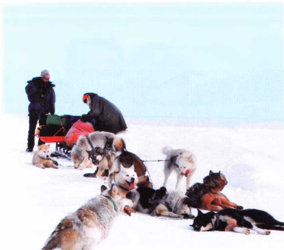
Главное богатство чукчи – его собачья упряжка. Специально для собак экспедиция тащила с собой мясо.

на нашу первую ночёвку в тундре. Выбрали место потише, где торчали какие-то кустики, поставили палатку. Готовились к ночлегу и наши сопровождающие, которые спали прямо на нартах под открытым небом, закутавшись в шкуры. Для собак мы специально тащили с собой мясо, которое один из провожатых раз в день вечером рубил и раскидывал мохнатым работягам. Мы шли по маршруту, проложенному по карте, и должны были дойти до начала следующего участка пути