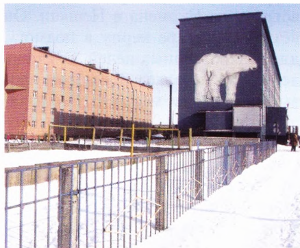
Стены домов украшены изображениями на чукотские национальные мотивы. Люди живут цивилизованной жизнью, ходят автобусы.