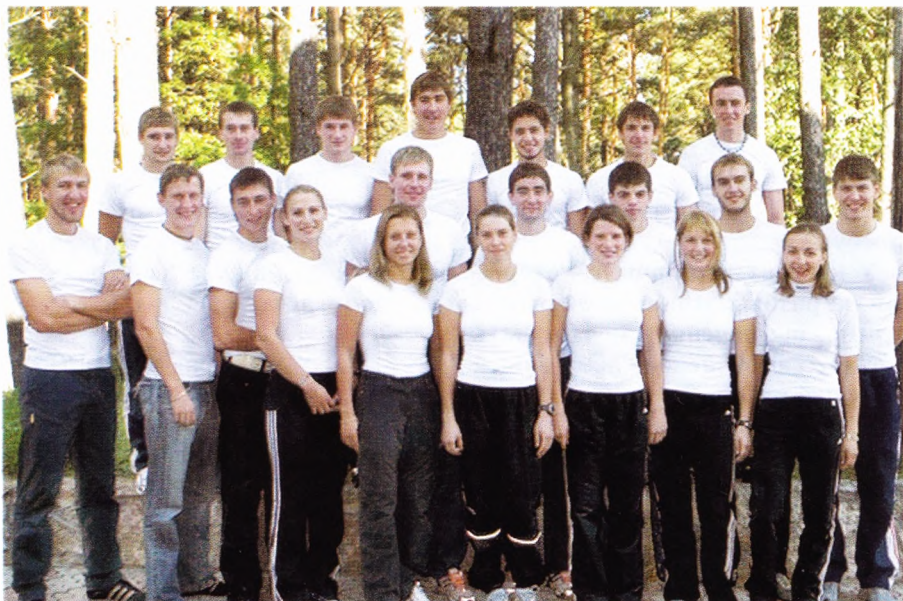
2006 г. Основной состав сборной России по лыжным гонкам.

– Собственно ходом тренировочного процесса, контрольными тренировками, а также прошлогодним рейтингом спортсменок. Раз, к примеру, Чепалова и Москаленко имеют место в красной группе FIS, значит, они поедут на этапы Кубка мира автоматически. О своей программе я подробно расскажу девочкам на первом сборе в Греции 20-30 мая. Пока могу гарантировать только одно – тренироваться они будут много. Естественно, в работе с опытными спортсменками я буду какие-то моменты индивидуализи-