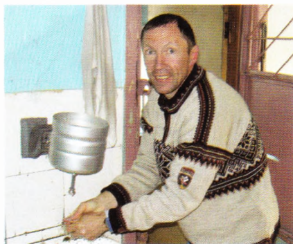
С двумя первыми ночёвками проблем не было.