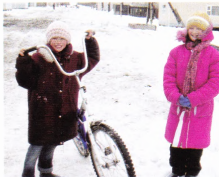
Посёлок Нешкан. На ходу – все виды транспорта.