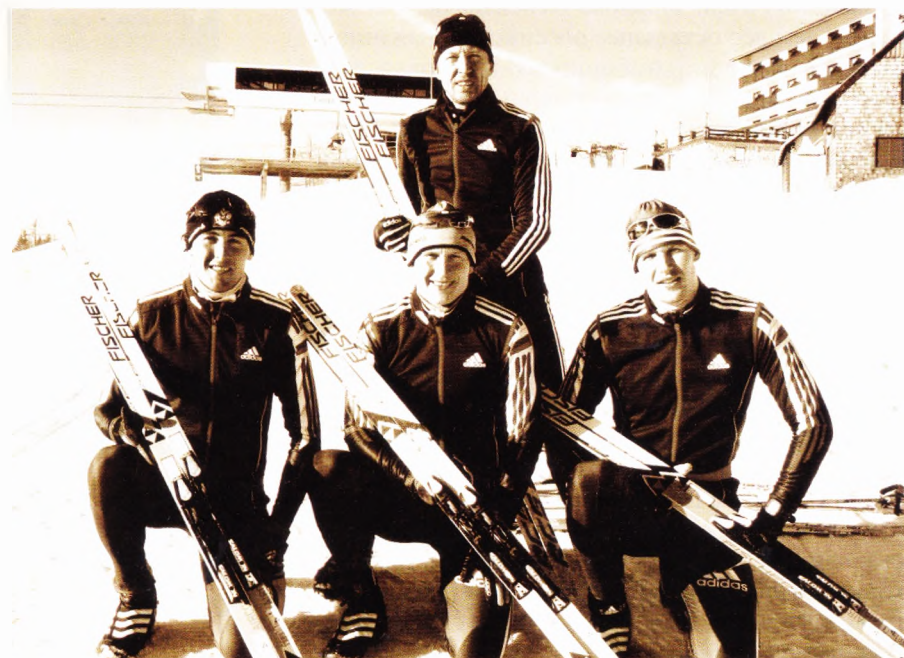
2 декабря 2004 года. На смену ветеранам подросла молодёжь.