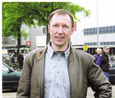
...май в Амстердаме.

ко побед. Хочется, конечно, чтобы появился гонщик класса Владимира Смирнова или Бьорна Дэли, но сейчас звезд такого масштаба в лыжах вообще не стало. Элофссон по каким-то причинам никак не реализует свой потенциал, Тайхманн, несмотря на все его лидерские претензии, даже на 20-е места откатывался. Многое покажет чемпионат мира.