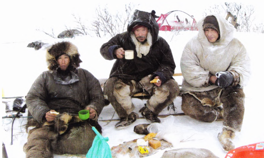
Приготовить завтрак в тундре не составляет проблем.

Дойдя до впадающей в океан реки, мы должны были пойти по ней вверх, в тундру. Но зрелище, представшее перед нами, заставило нас остановиться. В самом устье реки было огромное пространство, усеянное тушами мёртвых моржей. Их, наверное, было больше сотни. Чукчи-охотники рассказывают, что осенью прошлого года наша дальняя авиация возобновила патрулирование границы (видимо, керосин появился). А моржи в это время кишат на лежбищах, осенью они как