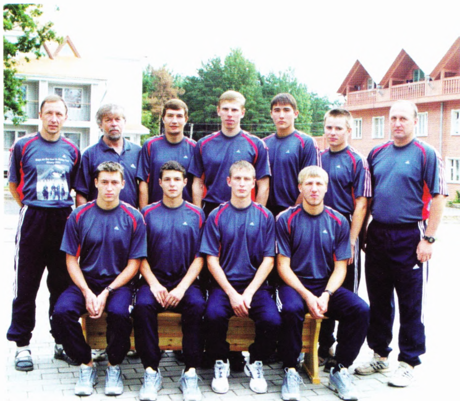
Мужская сборная образца 2005 года.

– Наверное, если бы стал искать, нашёл бы контракт. Но уехать за границу, если честно, не стремился. В