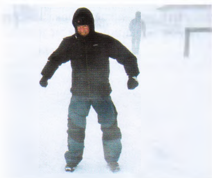
Снежный буран. Заметёт так, что хоронить не надо.