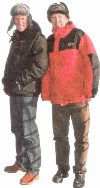
Спустя десятилетие олимпийские чемпионы Вегард Ульванг и Алексей Прокуроров вновь встретились на земле Чукотки.

После прилета в Анадырь нам еще предстояло перебраться в Бухту Провидения на самолете. Там надо было пересесть на вертолет и уже лететь на побережье океана, от-