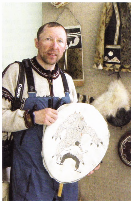
При мастерской открыт музей, в котором есть экспонаты середины прошлого века – полностью ручной работы.